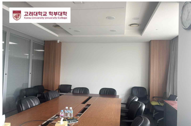
<그림 2> 로고 첨부 예시

※ 로고 다운로드: LMS( https://lms.korea.ac.kr/ ) → 2026학년도 창의연구 프로젝트 (CRP) 또는 창의연구 심화프로젝트 교과목(ACRP) 이수 → [과제] 최종보고서